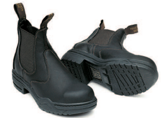
► PROTECTIVE JODHPUR

Lämpöiset, nauhalliset, monipuolisilla teknisillä ominaisuuksilla varustetut talviratsastuskengät. Thermolite-vuoraus. Koot 32 - 46.