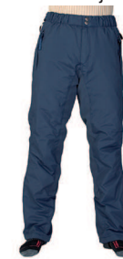
► WARM RIDER

Linjakas fleeecepusera konttiteräin. Useita väri vaihtoehtoja.