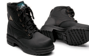
► RIMFROST PADDOCK

Thermolite-vuoratut, vetoketjulliset talviratsastussuorpaat, joissa kaikki Mountain Horse -jalkineille ominaiset tekniset toiminnallisuudet. Vedenpitävät ja hengittävät. Kaksi eri varsivevyttä. Koot 32 - 46.