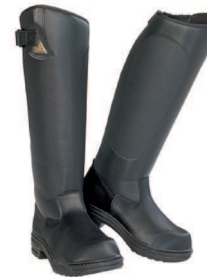
► RIMFROST RIDER

Miellyttävät puuvillaiset matalavyötäröiset ratsastushousut. Tekstiilipolvipaikka tai kokopaikka. Useita väri vaihtoehtoja.